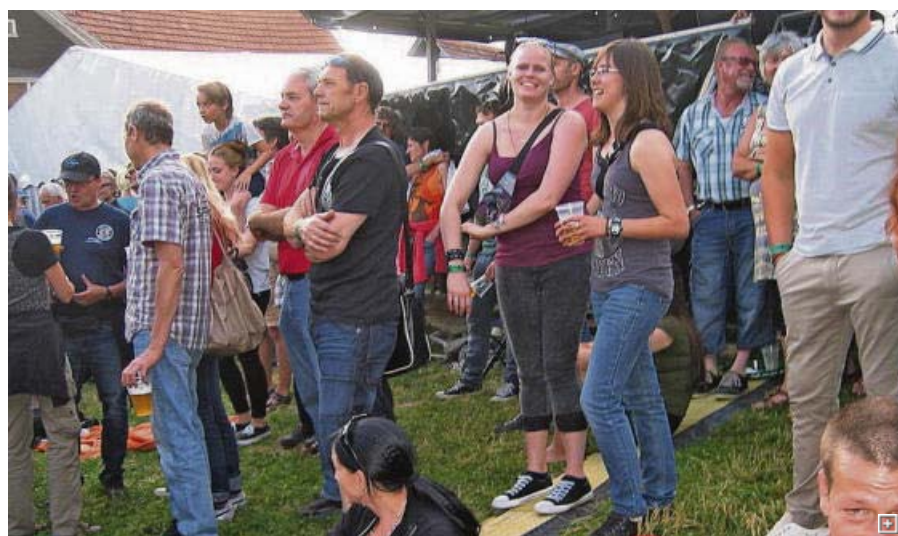
Ob sitzend oder stehend – die Bühne stand im Fokus.

WOLFHALDEN. Ein begeistertes Publikum besuchte am Wochenende das Gratis-Open-Air «Rock the Wolves» in Wolfhalden. Weltstars wie The Animals & Friends sorgten für ausgelassene Stimmung auf dem Festgelände.